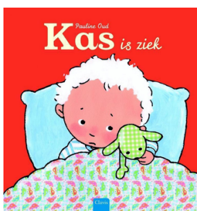
Kas is ziek (Pauline Oud) Uitgeverij Clavis (2015)

De knuffels van Zaza liggen sip op de bank. Zijn ze soms ziek? Zaza onderzoekt ze één voor één. Bij Mo de slang plakt ze een pleister. Nu willen de anderen natuurlijk ook een pleister van Zaza, en nog iets anders... Vanaf ca. 2 jaar.