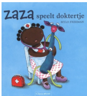
Zaza speelt doktertje (Mylo Freeman) Uitgeverij Clavis (2024)

Anna voelt zich niet lekker. Haar hoofd doet pijn en ze heeft het zo warm. Op haar buik heeft Anna rode vlekjes. Ze heeft waterpokken! Samen met mama gaat Anna naar de dokter. Hij onderzoekt haar en belooft dat ze snel weer beter wordt. Een verhaal over ziek zijn en naar de dokter gaan. Vanaf ca. 2 jaar.